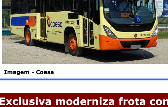
Imagem - Coesa

De acordo com a fabricante, seu modelo Torino possui maior largura interna, o que garante amplo espaço para circulação, novos conjuntos ópticos traseiro e frontal que incluem luz diurna, que proporciona mais segurança no trânsito urbano, e painel de instrumentos com tela colorida de LCD de 3,5 polegadas. Internamente, conta com iluminação em LED e 38 poltronas do tipo urbana, estofada, com encosto alto e 860 mm de largura.