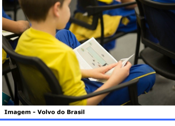
Imagem - Volvo do Brasil

Acesse os materiais da campanha "Parar, Olhar, Acenar" em www.volvo.com.br/pvst .