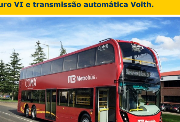
Imagem - Alexander Dennis

O futuro corredor Línea 7, da Avenida Paseo de la Reforma, na Cidade do México, conheceu recentemente as novas unidades dos ônibus que serão operados em seu sistema. Fabricadas pela montadora britânica Alexander Dennis, de modelo possui 13 metros de comprimento, dois níveis, 4,14 metros de altura, duas portas, piso baixo integral, capacidade para 130 passageiros, motorização Cummins Euro VI e transmissão automática Voith.