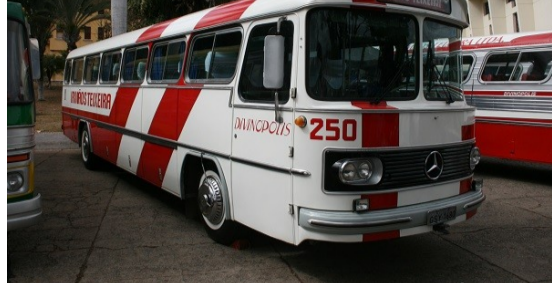
Imagens - Revista AutoBus