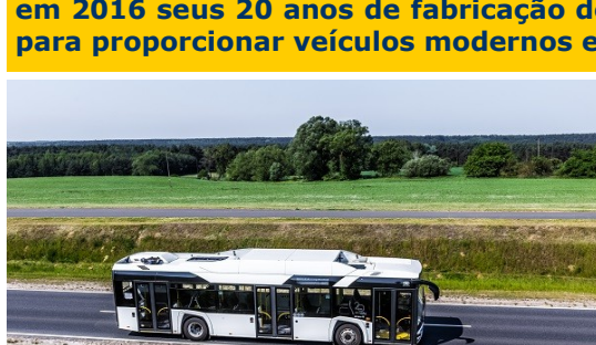
A nova geração do Urbino conta agora com a motorização movida pelo gás natural

Tome por exemplo a montadora de ônibus polonesa Solaris Bus & Coach que irá aproveitar o Salão de Hanover 2016, a IAA, para mostrar seus mais novos lançamentos dentro da plataforma de modelos urbanos Urbino, movido a gás natural e também com tração híbrida (diesel/elétrica). A Solaris celebra em 2016 seus 20 anos de fabricação de ônibus, sempre utilizando a tecnologia para proporcionar veículos modernos e ambientalmente corretos.