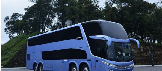
Os novos ônibus possuem chassis das marcas Mercedes-Benz e Volvo