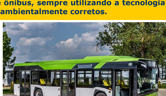
A tração híbrida (diesel/elétrica) utiliza o conceito de série HybriDrive, da marca BAE Systems