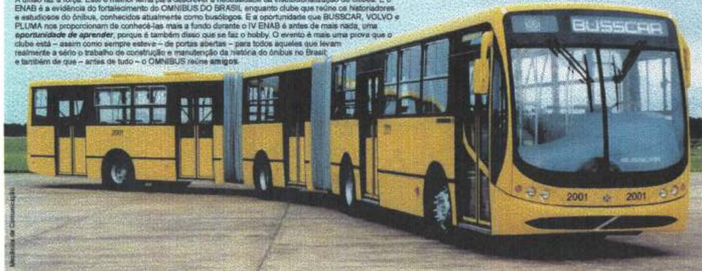
Mecânica de Comunicação

A união faz a força. Este é melhor lema para descrever a necessidade da institucionalização de clubes. E o ENAB é a evidência do fortalecimento do OMNIBUS DO BRASIL enquanto clube que reúne os historiadores e estudiosos do ônibus, conhecidos atualmente como busólogos. E a oportunidade que BUSSCAR, VOLVO e PLUMA nos proporcionam de conhecê-los mais a fundo durante o IV ENAB é antes de mais nada, uma oportunidade de aprender, porque é também disso que se faz o hobby. O evento é mais uma prova que o clube está - assim como sempre esteve - de portas abertas - para todos aqueles que levam realmente a sério o trabalho de construção e manutenção da história do ônibus no Brasil; e também de que - antes de tudo - o OMNIBUS reúne amigos.