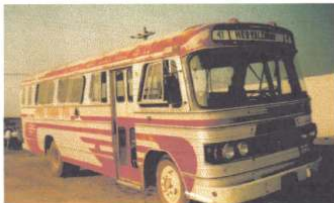
BUSSCAR Oswaldo Teodoro Born

A VCG - Viação Campos Gerais é a operadora do transporte urbano e suburbano na cidade de Ponta Grossa (PR) fazendo parte do grupo Gulin. Sua frota é bastante diversificada tendo sido modernizada recentemente com novos veículo Busscar, incluindo articulados Volvo e padrons Scania e Mercedes Benz.