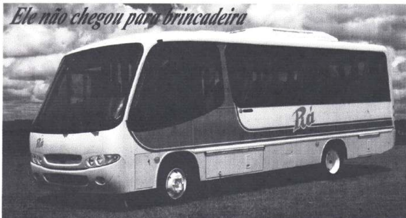
Comil Piá sobre chassi Volkswagen 8.140CO