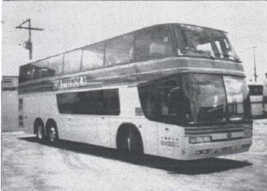
Acima Marcopolo Paradiso GV1800DD Mercedes Benz plataforma O400 RSD prefixo 940 recentemente adquirido pela Viação Capriol de Campinas - SP