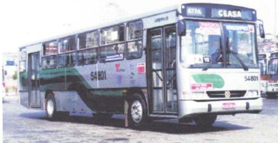
Busscar Urbanus S'95 2p denominado Ecobus

A Busscar, fabricante de carrocerias, de Joinville (SC) lançou recentemente uma nova opção de seu modelo urbano Urbanuss encarroçado sobre o chassi Scania L94UB com piso baixo. As cinco primeiras unidades foram entregues à empresa argentina Basuir Motor S. A. e contam com 3 portas (sendo a primeira e a terceira com largura 930 e a central com 1175mm). Os ônibus serão utilizados na região de Buenos Aires.