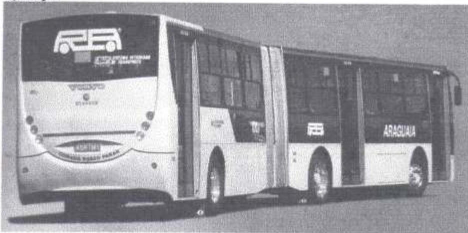
Um dos novos articulados Millennium Volvo B10M adquiridos pela Rápido Araguaia de Goiânia - GO

Errata Na edição 28 - Quadro de Aquisições - a informação dos Busscar Jum Buss adquiridos pela Continental está incorreta quanto ao chassi utilizado: são Scania K124; na edição 25 a sede correta da empresa Aparecida é na cidade de Imperatriz - MA.