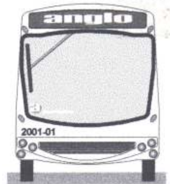
Vista frontal Carroceriã Anglo Centurion de Osvaldo Teodoro Born