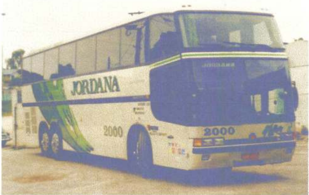
Acima Marcopolo Paradiso GV1450LD Scania K113 prefixo 2.000 quando pertencia à Jordana de Curitiba (PR). Observe a coluna do para brisa igual aos 1450 comuns.

Um Low Driver diferente: foi visto com o nome da empresa SOL DO RIO e prefixo 8.000 o Marcopolo Paradiso GV1450LD que foi o primeiro Low Driver adquirido no estado do Paraná e pertencia à empresa Jordana rodando com o prefixo 2.000. A nova proprietária manteve o lay-out da pintura apenas acrescentando seu telefone para contato na traseira. Como detalhe mais interessante este 1450LD tem uma coluna na junção frente/lateral superior igual aos 1450 comuns. Observe na foto abaixo.