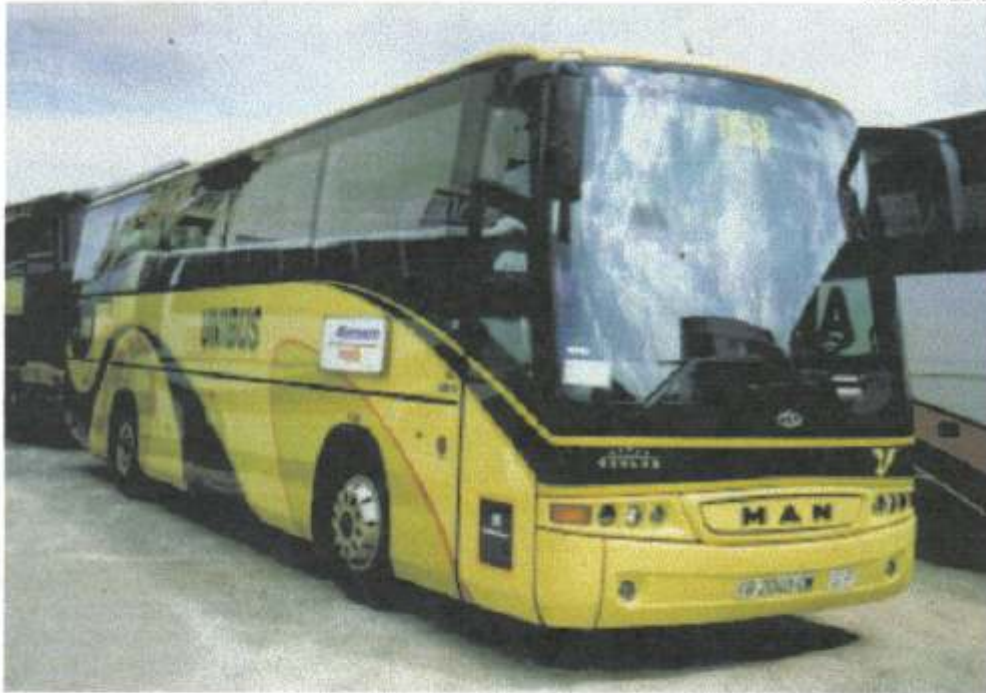
Ônibus carroceria Beulas Stergo E, chassi Man 18350, ano 1998, da empresa Unibus de Mallorca, Espanha.