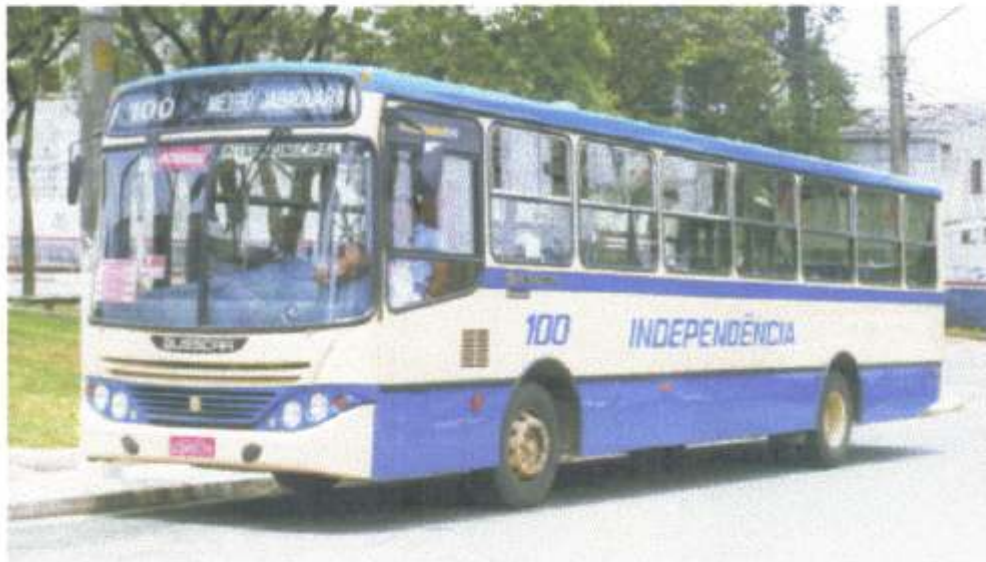
Edição da Costa

O novo Urbanuss série 98/99 da Busscar vem conquistando clientes em todo o Brasil e nas mais diversas configurações de chassis. De norte a sul do país novas unidades despertam a atenção dos passageiros pelo seu desenho diferenciado e seu charme particular.