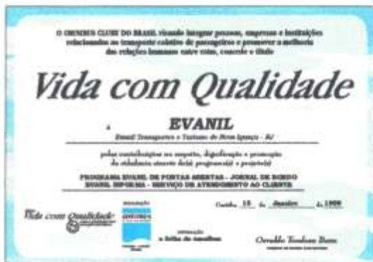
Cópia do Certificado enviado à EVANIL.

Há cerca de um ano e meio o OMNIBUS CLUBE resolveu instituir e conceder o título Empresa Amiga e Humana àquelas empresas ou instituições – de alguma forma relacionadas ao clube – que se destacassem em projetos ou programas que promovessem e dignificassem o ideal da cidadania em seus funcionários-colaboradores, clientes e na comunidade em geral. Agora, em sua segunda edição, o nome do título mudou para Vida com Qualidade , mas seu objetivo é o mesmo: demonstrar idéias que resignifiquem os conceitos que todos nós temos em relação às nossas relações humanas, prezando pelo respeito à cidadania de cada um. E as empresas ou instituições podem contribuir com isto no instante em que o