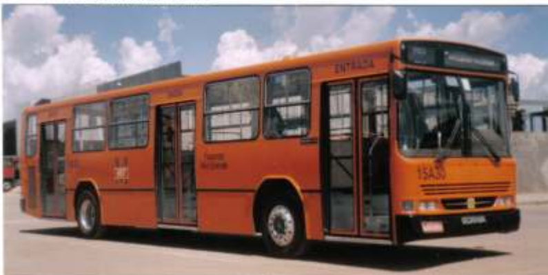
Buscar Urbanus Scania L113 com rodas de alumínio recentemente adquirido pela Leblon