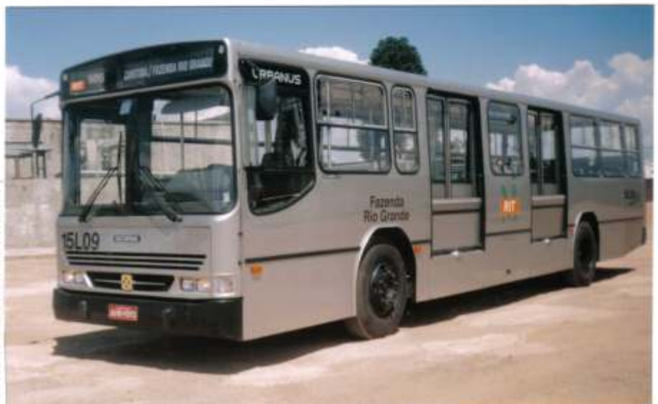
Buscar Urbanus Scania L113CM figurinho integrante de um lote de 12 para a ligação Curitiba - Fazenda Rio Grande