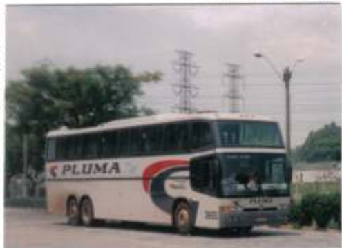
Marcopolo Paradiso GV1450 em São José dos Campos/SP

Além de renovar a frota recentemente com Marcopolo Paradiso GV1150 e 1450 (Scania K113 e Volvo B12) a empresa Pluma acaba de adquirir o modelo Marcopolo Double Decker para operação de suas linhas regulares. Em breve mostraremos fotos dos novos veículos.