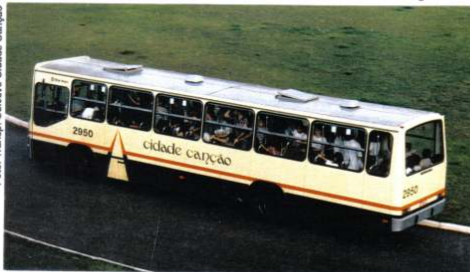
Marcopolo Torino Mercedes-Benz OF1618

Operando na cidade de Maringá, norte do Paraná a CIDADE CANÇÃO é uma empresa exemplar mantendo a frota renovada e prestando bons serviços aos usuários. Possui na cidade 50 linhas urbanas e 14 metropolitanas operandas com aproximadamente 180 veículos, a saber (*):